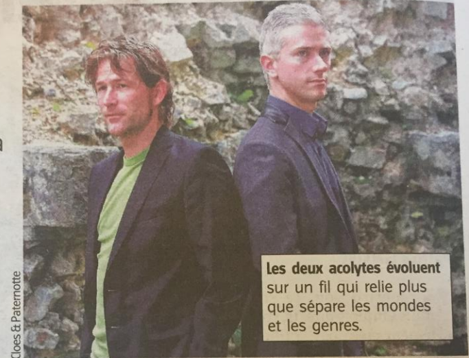
Les deux acolytes évoluent sur un fil qui relie plus que sépare les mondes et les genres.